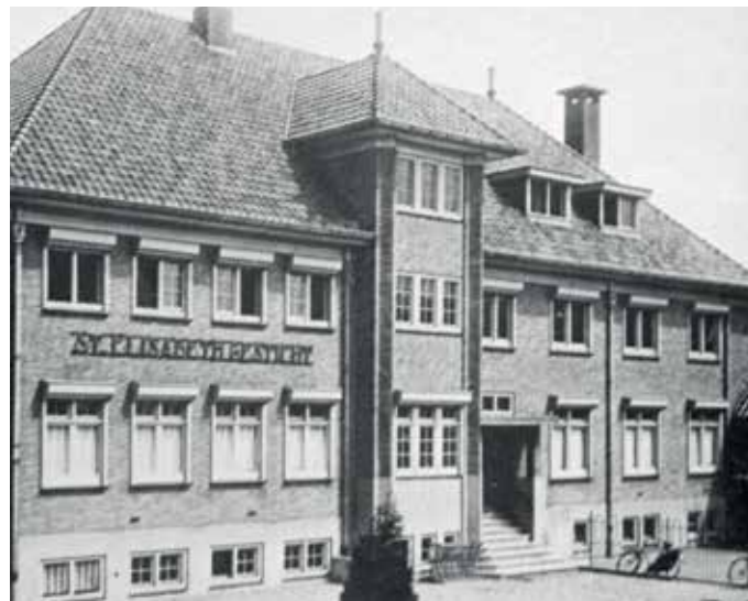
Klooster Sint Elizabeth in Beneden-Leeuwen.