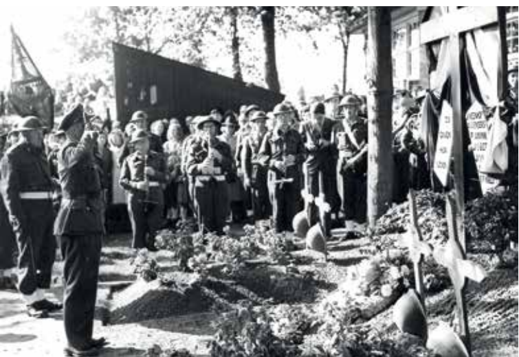
De eerste herdenking van gesneuvelde Stoottroepers op 13 oktober 1946 te Beneden-Leeuwen.