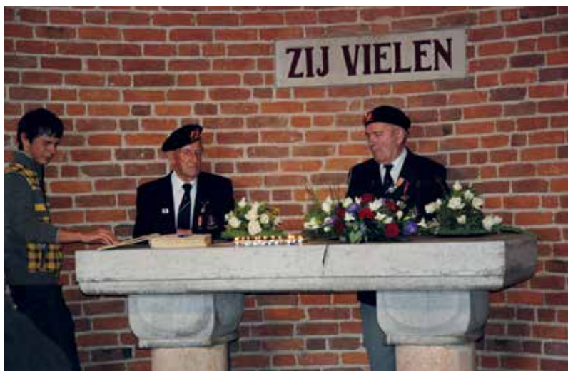
Stoters van kring Maas en Waal van de BOSS.

Het werkcomité, dat het bestuur van de stichting ondersteunt bij de jaarlijkse organisatie, bestond voornamelijk uit leden van kring Maas en Waal van de BOSS.