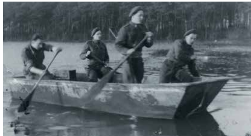
Hoogwater voor Stoottroepers aan de Maas.

Ook de Tilburgse Stoottroepers moesten ervaren dat de wachtdiensten aan de Waal geen sinecure waren. Tot het allerlaatste moment bleven de Duitsers speldenprikken uitdelen. Nog op 28 april 1945 wisten zij de Waal over te steken en twee Stoters krijgsgevangen te maken.