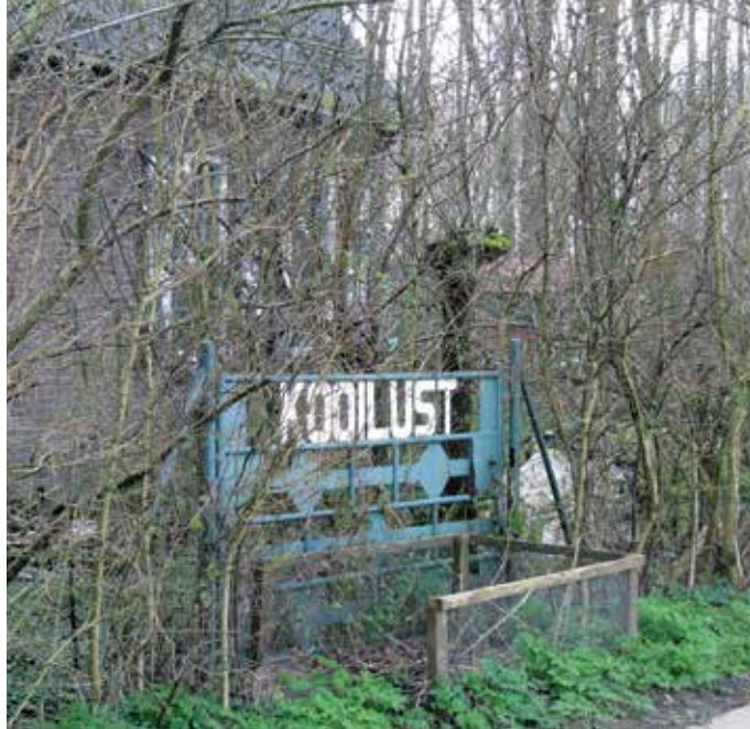
Schuiladres van de ondergrondse. De eendenkooi aan de Weteringstraat in het Wamelse veld.

In Maas en Waal zelf waren weinig sabotage-objecten. Geen spoorwegen en stations, geen bruggen of belangrijke wegen. Elk dorp had een eigen verzetsgroep met belangrijke leiders, zoals kapelaan Thijssen in Deest, Elemans uit Horssen en Wim de Leeuw uit Alphen.