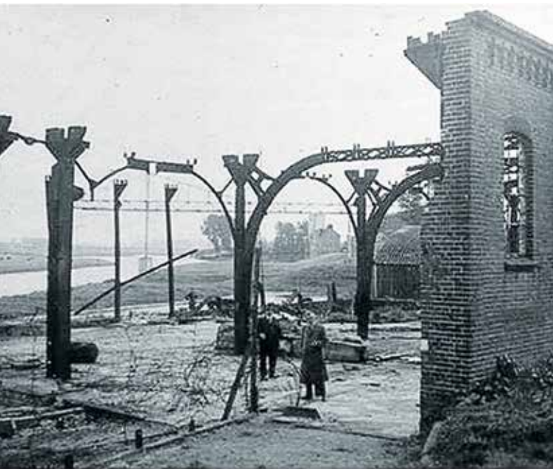
Afgebrande zagerij van houthandel Van Heck.

In de nacht van 6 op 7 oktober komen Duitsers in drie boten de Waal over en steken over een afstand van twee en een halve kilometer 43 dijkhuizen in brand. Op brute wijze worden mensen uit hun huizen gejaagd. Vervolgens steken de Duitsers met fosfor de huizen in brand. De ondergrondse is absoluut niet opgewassen tegen deze goed gewapende tegenstanders. Bij de landing aan de Waaloever in Beneden-Leeuwen verrassen de Duitsers de ondergrondse met handgranaten. Zij zetten meteen wachten uit en gaan vervolgens alle huizen aan de dijk langs in oostelijke richting. Huis na huis steken ze in brand. Zij drijven gevluchte mensen voor zich uit als een levend schild. Er volgt verder bijna geen schot. Niemand wordt gedood. Maar de angst in het dorp is ontzettend groot. Mensen slaan op de vlucht weg van dijk. De felle oostenwind doet grote vonkenregens ontstaan. De lucht is vervuld van geschreeuw van kinderen, blaffende honden en het geraas van de vlammen. Paarden verbranden levend in hun stallen. De vlucht van mensen gaat dwars door boomgaarden, onder prikkeldraad door, langs bessenpollen, door sloten en greppels. De vluchtenden worden opgevangen door dorpsgenoten. Velen vluchten door de velden richting Maaskant.