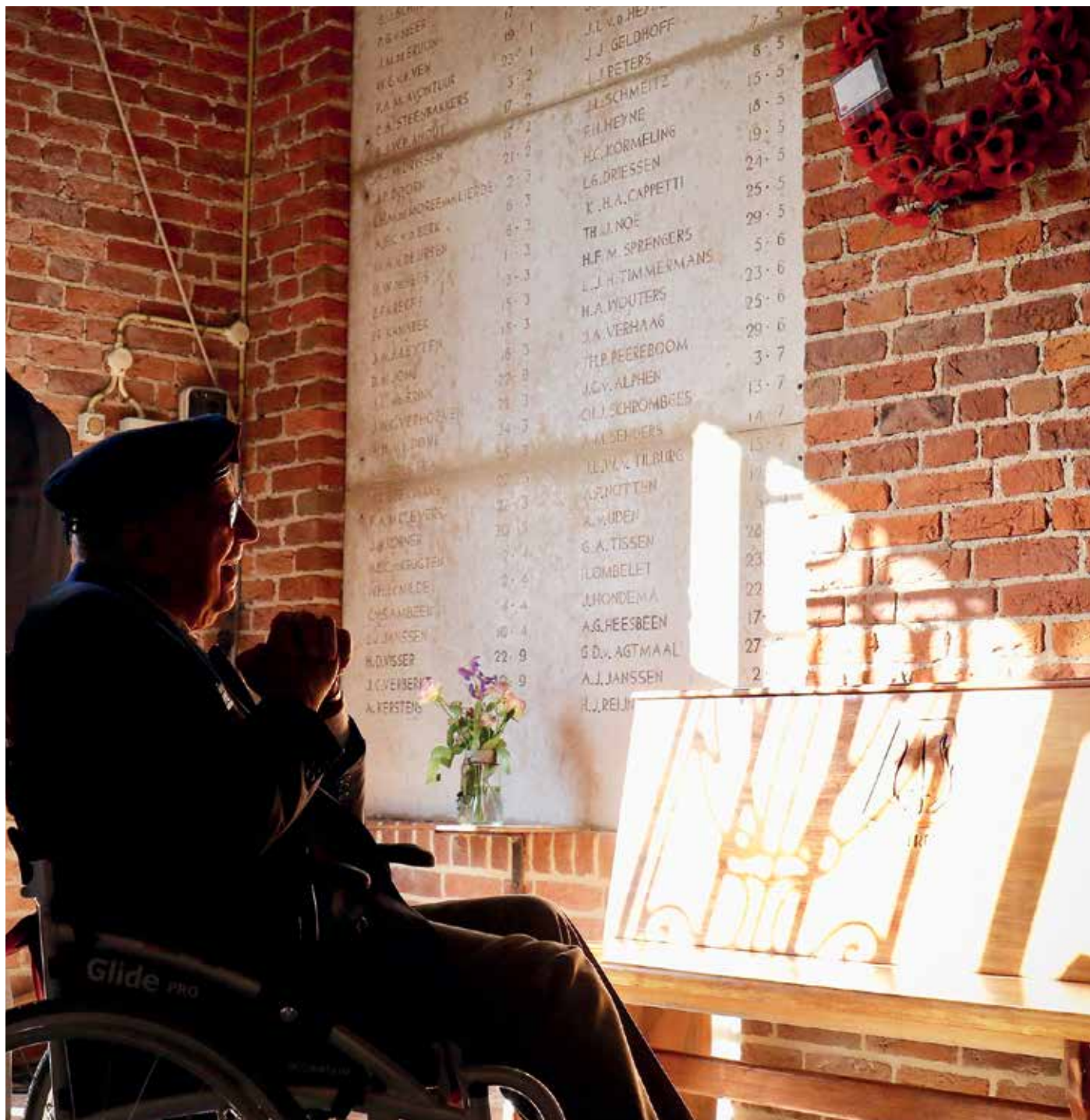
Fragment van een tableau, waarop de namen van gesneuvelde Stoottroepers zijn aangebracht, op de wand van de gedachteniskapel.