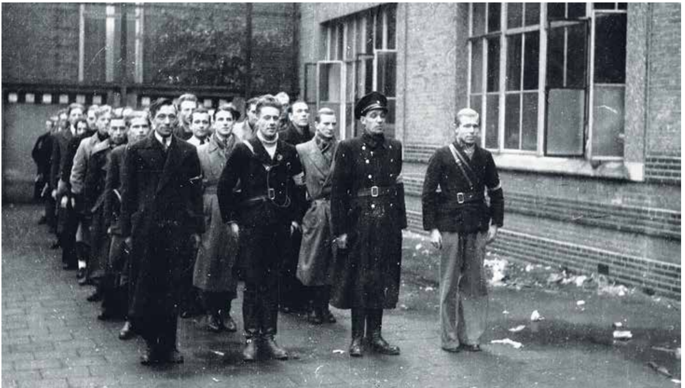
Vrijwilligers melden zich aan bij de Binnenlandse Strijdkrachten.

Ondertussen blijft de schemertoestand in Maas en Waal voortbestaan. Overdag inzet van Engelsen en Irenebrigade, 's nachts verlaten zij de dijken en staat de ondergrondse alleen.