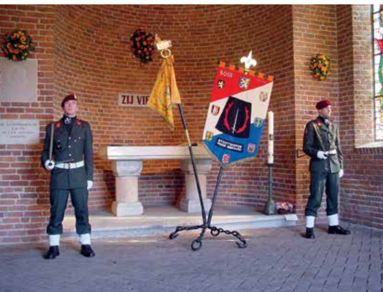
Erewacht van het Regiment Stoottroepen tijdens de herdenking.

Het plaatselijke 4 meicomité heeft de taken van kring Maas en Waal van de BOSS, waar nodig, overgenomen. De bijdrage van muziekvereniging Koning Willem III tijdens de herdenking op het ereveld is verder uitgebouwd. Het plaatselijke activiteitencomité verzorgt de beveiliging van de route voor de stille tocht.