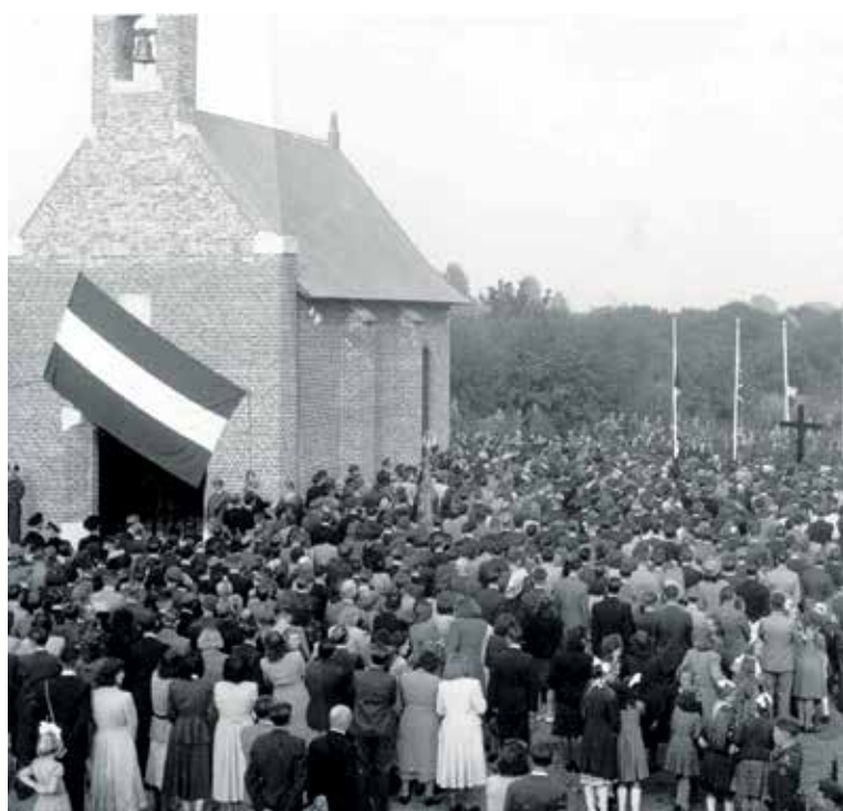
Herdenking en onthulling van de gedachteniskapel op 9 oktober 1949.

Op 9 oktober 1949, de zondag van de jaarlijkse herdenking, werd de kapel plechtig en officieel onthuld.