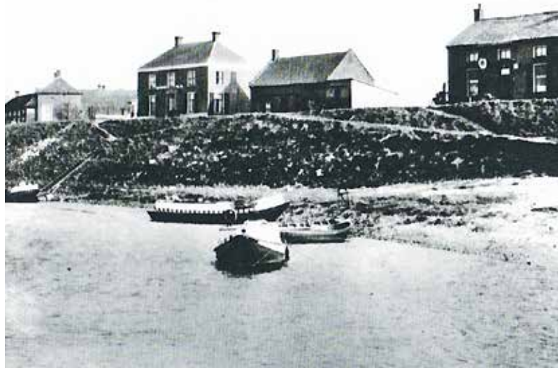
Huizen op de Waalbandijk vóór de brand van 6 oktober 1944.

In november van 1942 werd de Landelijke Organisatie voor hulp aan onderduikers (LO) opgericht. Zij zorgden voor bonkaarten die werden verkregen door overvallen op distributiekantoren. De LO zorgde voor verspreiding van onderduikers over verschillende adressen. De LO verspreidde daarnaast illegale krantjes. Deze verzetsgroepen opereerden aanvankelijk afzonderlijk van elkaar.