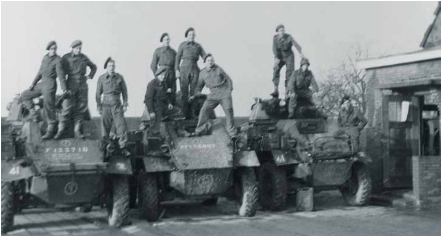
Stoottroepers van de 1ste Compagnie, poseren samen met Britse militairen van het 49th Reconnaissance Regiment op Humber pantserwagens.