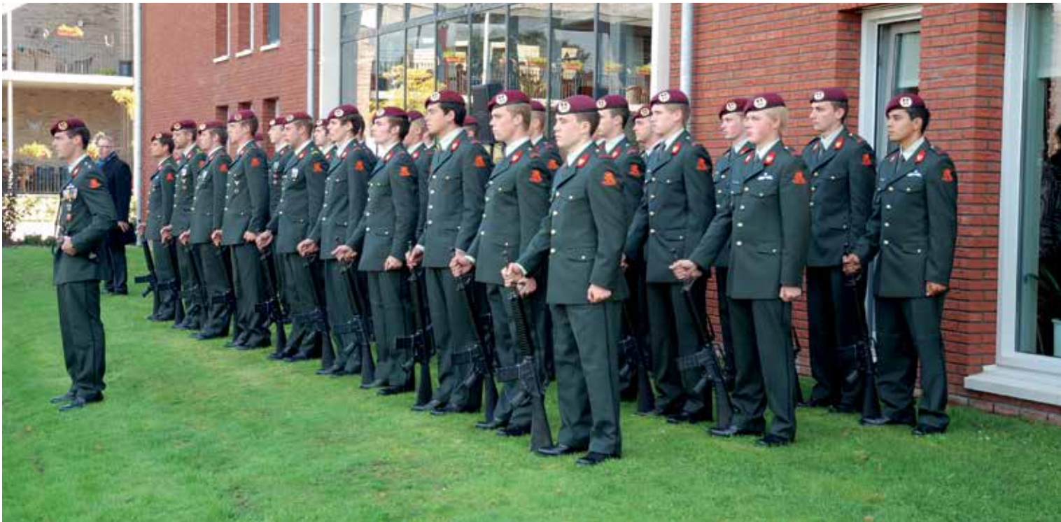
Erecompagnie van het Regiment Stoottroepen Prins Bernhard.