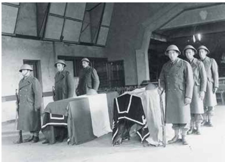
De gesneuvelden van de 1e Compagnie werden opgebaard in de Harmoniezaal Koning Willem III en vervolgens begraven in de kloostertuin.

Gewonde Stoottroepers werden voor verpleging naar klooster Elisabeth gebracht. De gesneuvelden van de 1e Compagnie Stoottroepen werden opgebaard in de Harmoniezaal Koning Willem III en vervolgens begraven in de kloostertuin. Daar kwam zo een begraafplaats tot stand. In totaal zijn er in het Land van Maas en Waal twaalf Stoters gesneuveld, waarvan acht van de 1e Compagnie. Een veelvoud raakte gewond.