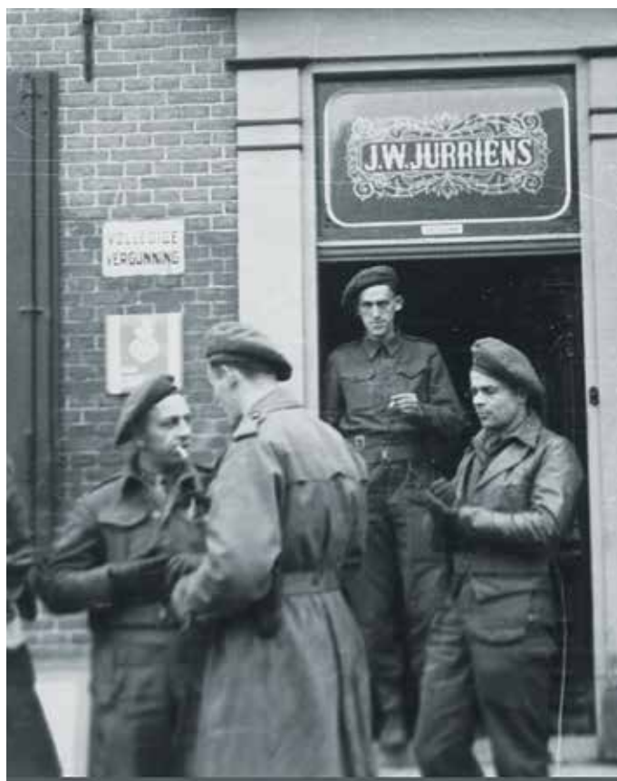
Commandopost van de Stoottroepen in Café Jurriëns.

De drie pelotons van de 1e Compagnie werden gehuisvest in een school te Boven-Leeuwen, een klooster te Wamel en op verspreide adressen in Beneden-Leeuwen. De compagniestaf kreeg onderdak in café Jurriëns, dat gevestigd was in laatstgenoemde plaats.