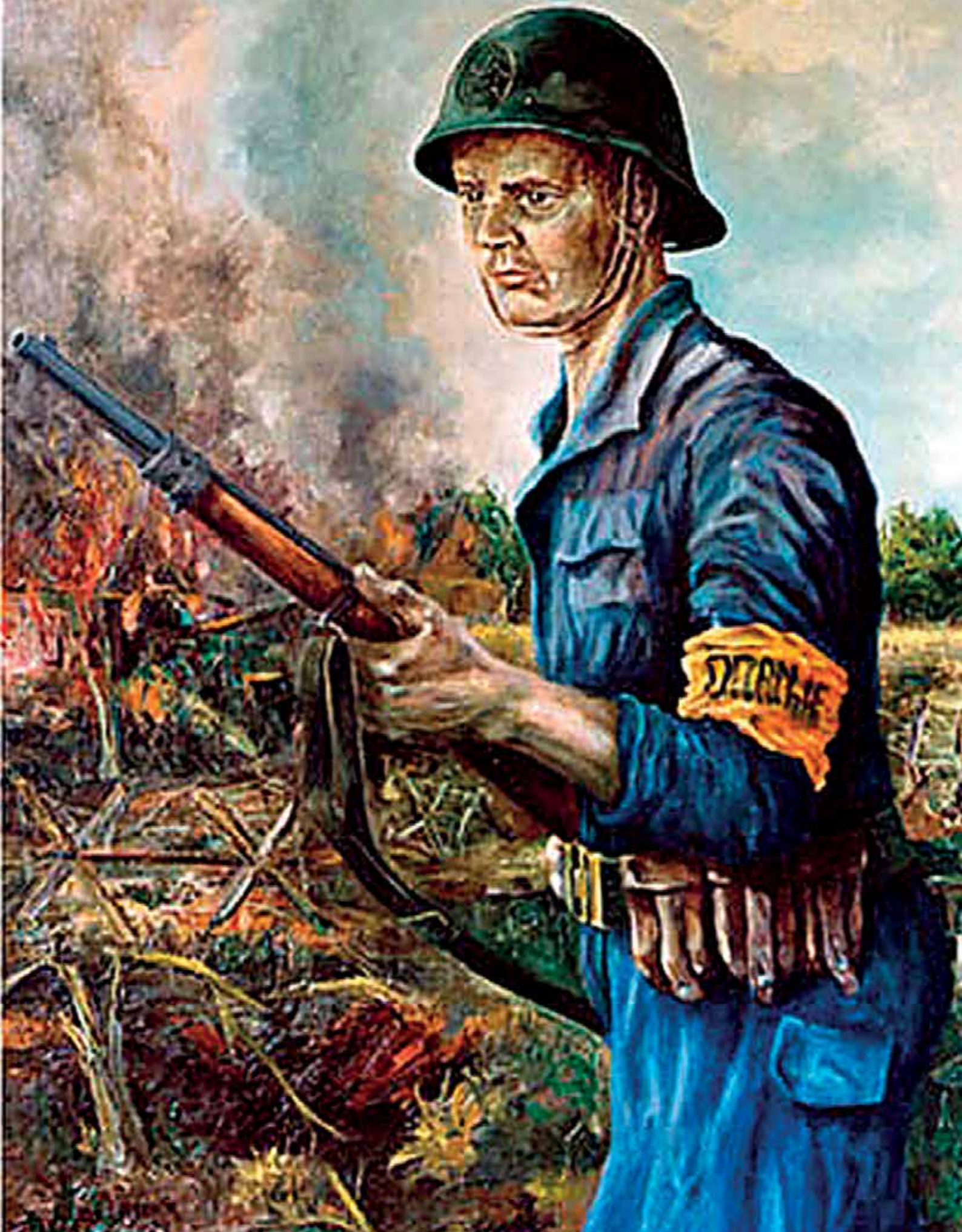
Stoottroeper van het eerste uur.