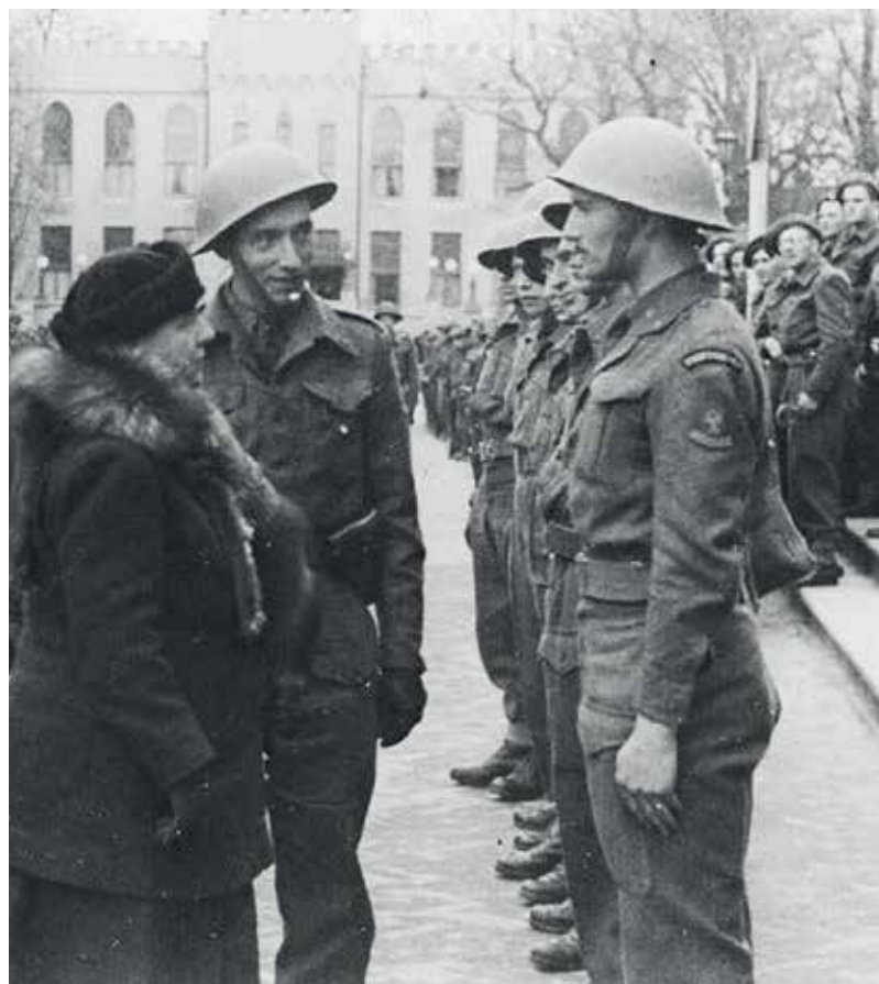
18 maart 1945 Tilburg: “...en dit Regiment zal blijven voortbestaan”.

Vanaf 29 juni 2002 wordt het Regiment Stoottroepen voortgezet met de naam Regiment Stoottroepen Prins Bernhard (RSPB).