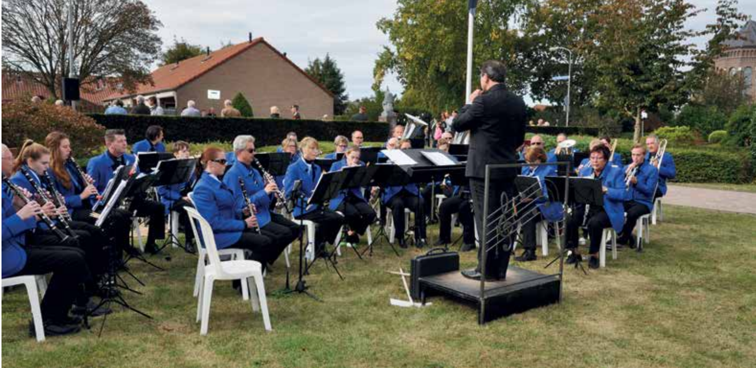
Muziekvereniging Koning Willem III.