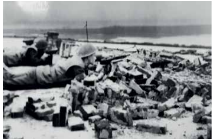
Stoottroepers op de Waalbandijk te Beneden-Leeuwen tussen de ruïnes van de dijkbrand.

De rust, waarover gesproken werd, zou het gevolg hebben kunnen zijn van een verhoogde waterstand in de Waal. Als de rivier buiten zijn oevers treedt en de uiterwaarden overstroomt, ontstaat er namelijk een watervlakte van enkele kilometers breed.