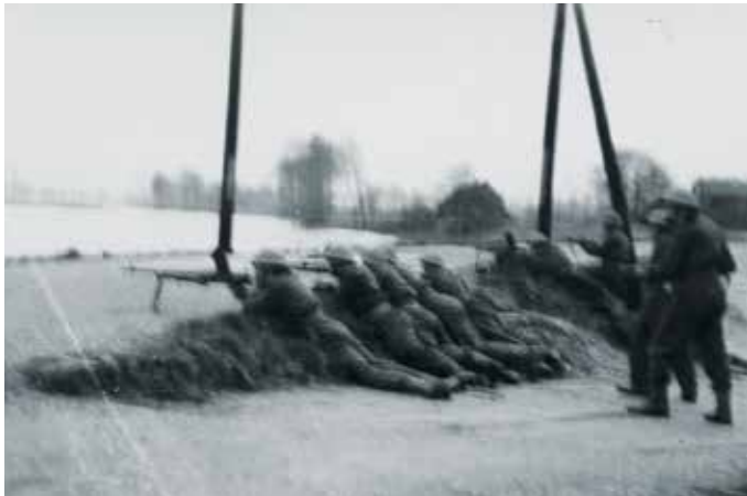
Oefening van de Stoottroepen in Boven-Leeuwen bij de oprit van de Molenstraat.

's Nachts kregen de mannen een snee brood met bacon en een keteltje thee mee. Als de dageraad weer aanbrak, gingen de Stoters naar hun logeeraadres, een verlaten (NSB) woning, schuur of school. Daarna slapen, daar waren ze dan aan toe. Er waren soldaten die in geen maanden een volledige nacht hadden geslapen. Als ze wakker waren, aten ze warm en werd er geoefend.