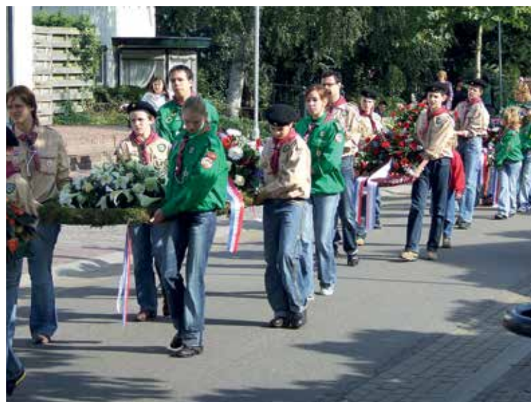
Kransdragers van Scouting Don Bosco.

Scouting Don Bosco is een vitale vereniging, die in de voorbereiding en de uitvoering van de herdenking met zijn leden een factor van belang is.