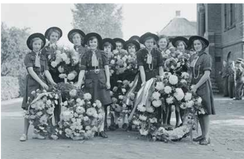
Kransdragers van Scouting Don Bosco tijdens de herdenking in 1950.

Zoals te verwachten leidde deze eerste herdenking al direct tot de gedachte deze plechtigheid jaarlijks in Leeuwen te herhalen, maar dan voor alle gesneuvelde stoottroepers. Dit was een uitstekend voornemen, omdat de Brabantse en Limburgse Stoters samen een honderdtal doden hadden te betreuren. De Limburgse Stoter, compagniecommandant Th. A. Dautzenberg, omgekomen op 12 oktober 1944 geldt als de eerste gesneuvelde Stoottroeper. Toen de eerste herdenking in Beneden-Leeuwen werd gehouden, waren ook in Indië al een dertigtal Stoters gesneuveld.