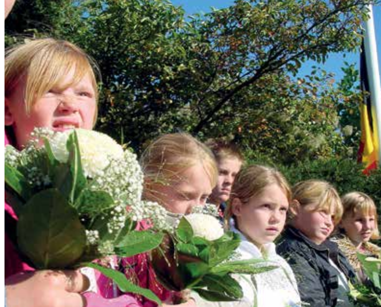
Leerlingen van OBS De Wijzer.

Maar Stoters van het eerste uur sterven allemaal op den duur. Zij, die het gemeenschappelijk gevoel van kameraadschap aan de dijk in september 1944 konden beschrijven, zijn er nog nauwelijks. Met hun heengaan lijkt het gevoel voor de herdenking bij de plaatselijke bevolking ook te sterven. Begrijpelijk, want velen in Leeuwen kenden ooit wel iemand, een familielid of bekende, die toen aan de dijk had gestaan in een blauwe overall. Die verwantschap dreef je naar de herdenking. Maar die drijfveer verdwijnt nu meer en meer. Verhalen worden ook niet meer doorverteld. Het verwatert! En daarom is het goed kennis te nemen van het ontstaan van het stoottroepersgevoel hier aan de dijk, toen in de periode van september 1944 tot mei 1945, hier in Maas en Waal. De betrokkenheid van de bevolking neemt de laatste jaren weer wat toe. De herdenking is in essentie dezelfde gebleven, maar de vorm is aangepast aan de tijd.