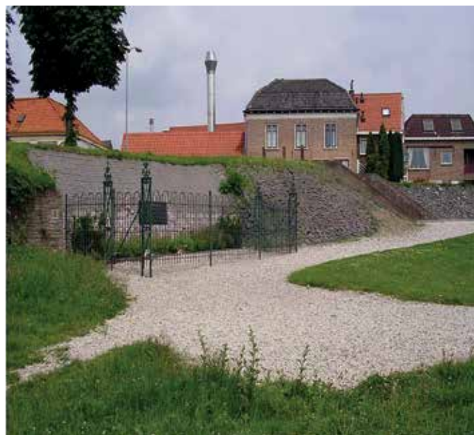
De kademuur in Tiel.

Op 19 september ontving de ondergrondse wapens van de Engelsen. Zij zetten wachten uit aan de dijk. Zo ook in Wamel, waar de ondergrondse het eerste vuurcontact had met Duitsers. Er werd geschoten op Duitsers, die met het pontveer de Waal overstaken. Dit liep rampzalig af. De Duitsers namen wraak, staken huizen in brand en fusilleerden 14 Wamelse mannen voor de kademuur in Tiel.