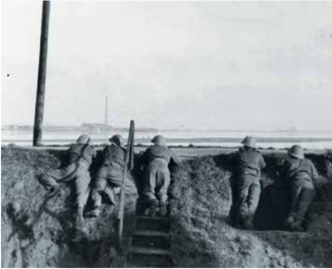
Stoottroepen in stelling aan de Waal te Beneden-Leeuwen.

De winter van 1944-1945, in bezet gebied bekend als de hongerwinter, was streng, bar streng. De soldaten hebben verschrikkelijke kou geleden. De voeding was nu goed geregeld. Mochten de voorraden uit Wijchen of Oss niet op tijd zijn geleverd, dan was er altijd wel een gulle buurvrouw. Later kregen de Stoters twee vrachtwagens tot hun beschikking om zelf voorraden te gaan halen.