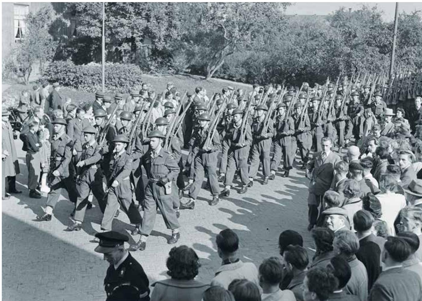
Erecompagnie van het Regiment Stoottroepen tijdens de herdenking in Beneden-Leeuwen op 15 oktober 1951.